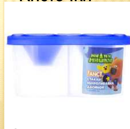
Стакан для воды