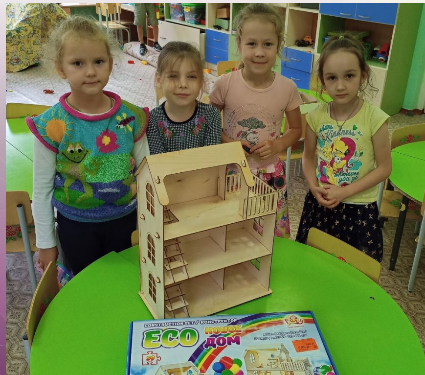
Деревянный дом для игры