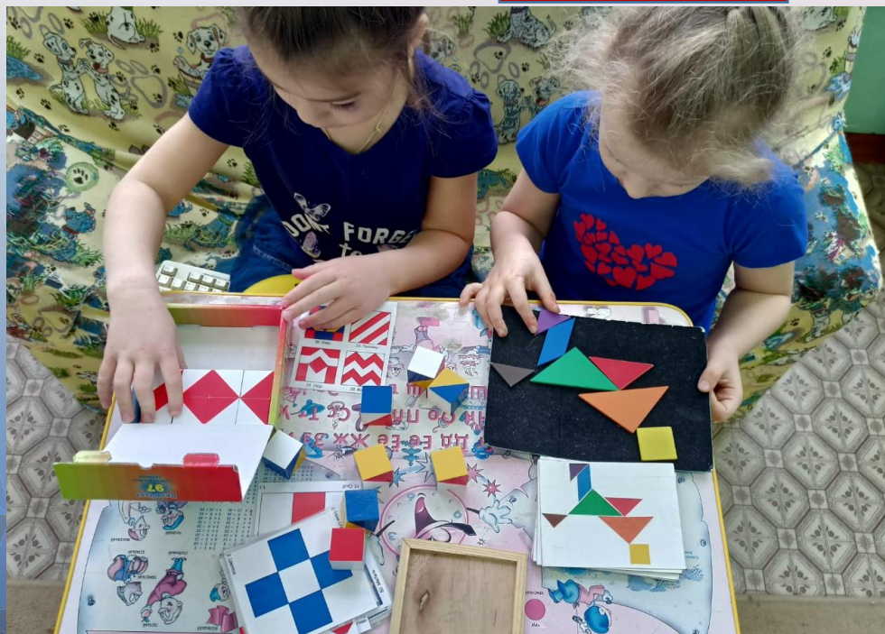
Кубики Никитина «Сложи узор»